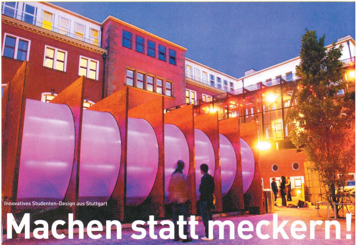
Innovatives Studenten-Design aus Stuttgart