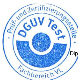
Dipl.-Ing. Frank Fehlauer Zertifizierer

Dieses Zertifikat einschließlich der Berechtigung zur Anbringung des GS-Zeichens ist gültig bis: 12.10.2029 Weiteres über die Gültigkeit, eine Gültigkeitsverlängerung und andere Bedingungen regelt die Prüf- und Zertifizierungsordnung.